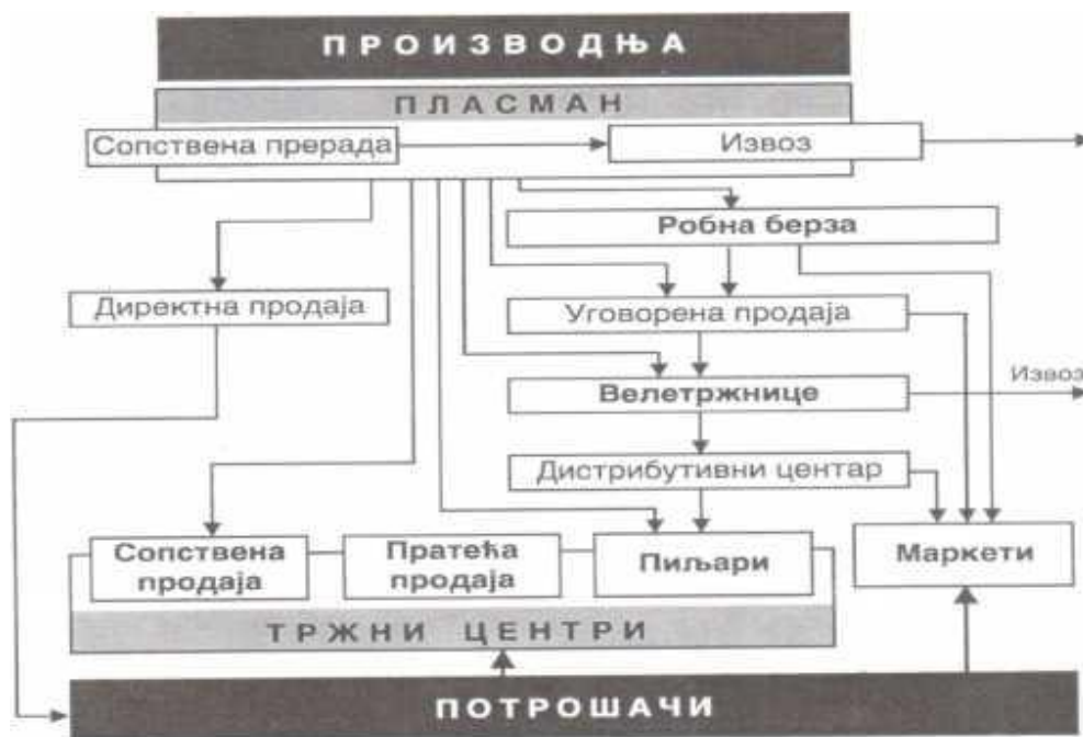
Канали дистрибуције прехранбених и других производа на велико и продаја на мало у тржним центрима

У промету и откупу пољопривредних производа пијаце учествују са од 35 - 38 % тржишног удела. Укупан промет робе на пијацама у Србији бележи благи раст. Пијачна делатност у Србији је у XXI век ушла са потребом прилагођавања новом таласу промена. Проблем у пијачарству јесте конкуренција супер и мегамаркета, експанзија безготовинског плаћања, кредитне картице и одређена промена навика и жеља купаца.